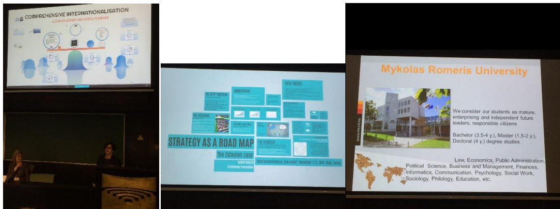
Tiina Kosunen (Finnland)

Tiina Kosunen berichtete über ein anderes Konzept der Internationalisierung, welches an der Universität von Helsinki angewendet wird, und zwar „ the comprehensive internationalisation “. Sie verwies auf das Akronym „TEAM“, mit T für together , E für everyone , A für achieves und M für more .