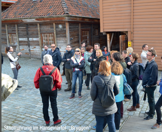
Stadtführung im Hanseviertel „Bryggen“

UNIVERSITY OF BERGEN STAFF MOBILITY WEEK