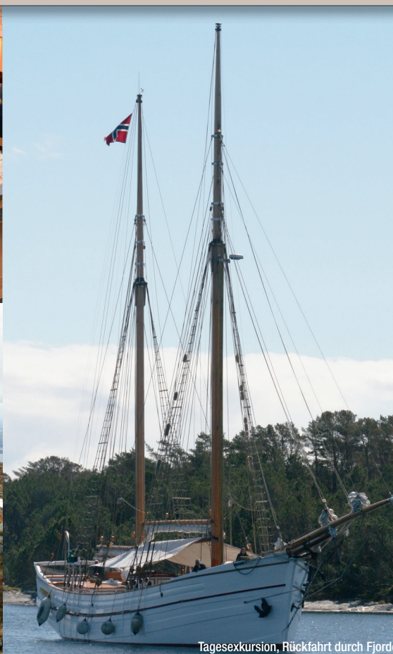
Tagesexkursion, Rückfahrt durch Fjorde